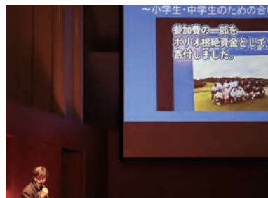
クラブ事業発表・三河安城RC