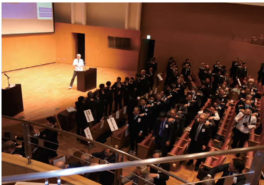
クラブ事業発表・会場風景

という考えで行いました。他クラブの活動内容を学ぶ機会として、刈谷、安城、西尾、碧南、西尾一色、高浜、西尾K I R A R A、三河安城、知立、各クラブの取り組みを会長様から発表していただきました。また、そのあとの懇親会では、アトラクションとしてクラブ対抗パフォーマンス歌合戦を開催し、大いに盛りあげられました。またポリオの募金活動にも皆様にご協力いただき80万円ものご寄付をいただきました。西三河分区が一つになった一日であります。以下はその時のスナップです。