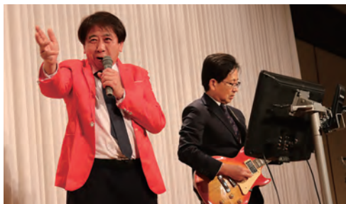
パフォーマンス歌合戦・碧南RC