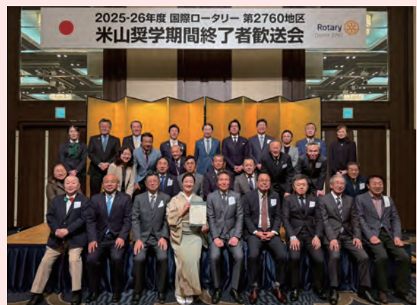
カウンセラー記念撮影