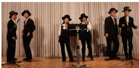
パフォーマンス歌合戦・刈谷RC