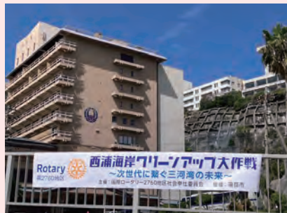
西浦海岸クリーンアップ大作戦