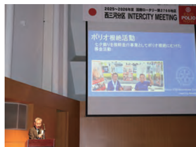
クラブ事業発表・安城RC