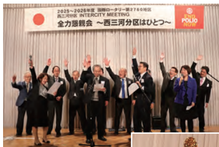
パフォーマンス歌合戦・西尾一色RC