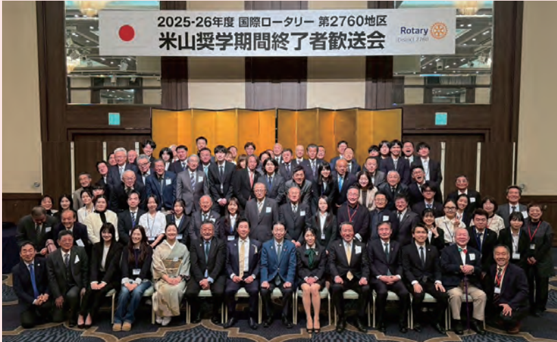
閉会后、全員での記念撮影