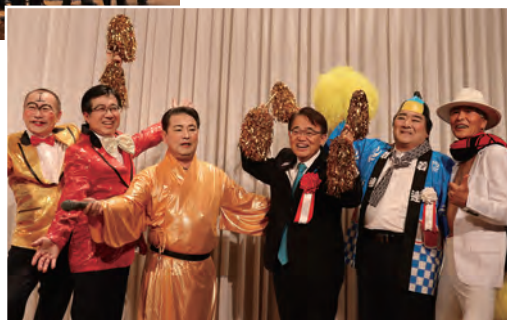
パフォーマンス歌合戦・知立RC