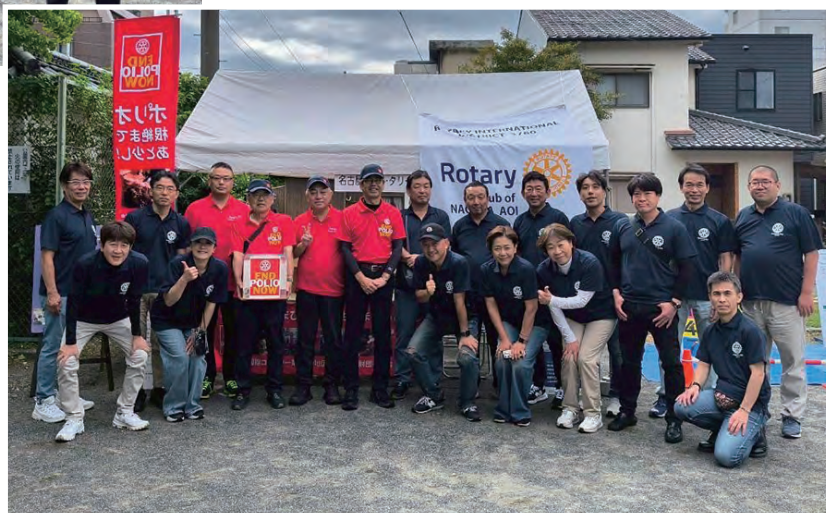
名古屋葵ロータリークラブ 当日参加メンバー19名