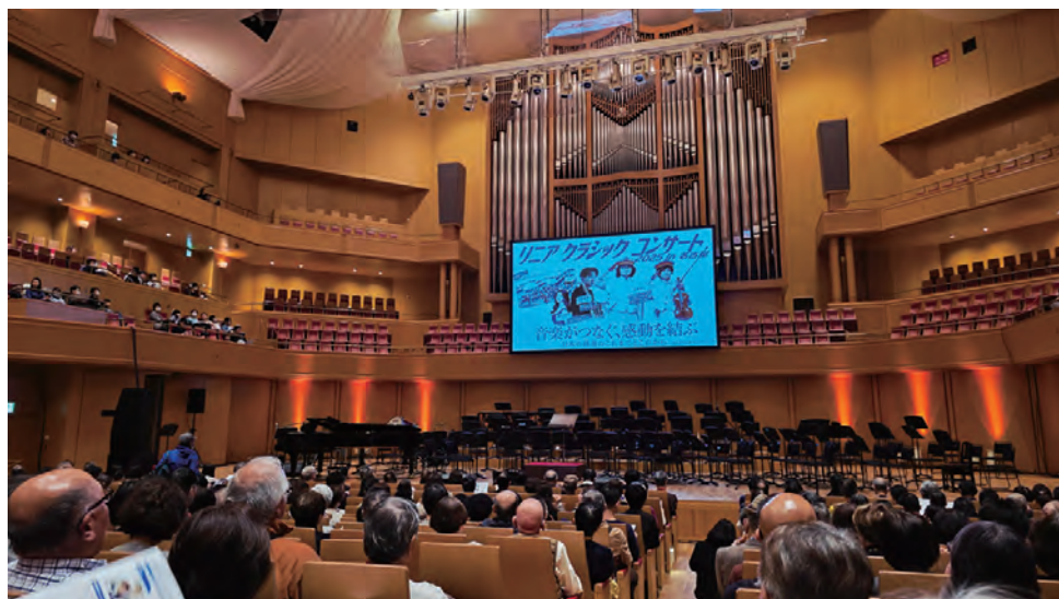
愛知県芸術劇場コンサートホールの様子