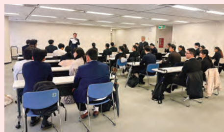
説明内容を聞いて 誓約書にサイン

世話クラブの皆様、そして奨学生にとって有意義な交流となりますよう、地区米山奨学委員会として、今後もしっかりとサポートしてまいります。