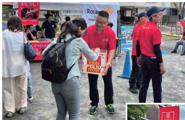
メンバーによる募金活動

これらの活動の中でも、特に親子向けイベント参加者に対しては、ポリオ根絶活動を実施し、ポリオについて学んでいただく機会を設けるとともに、募金活動を実施しました。