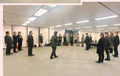
早朝から面接の準備をする面接委員