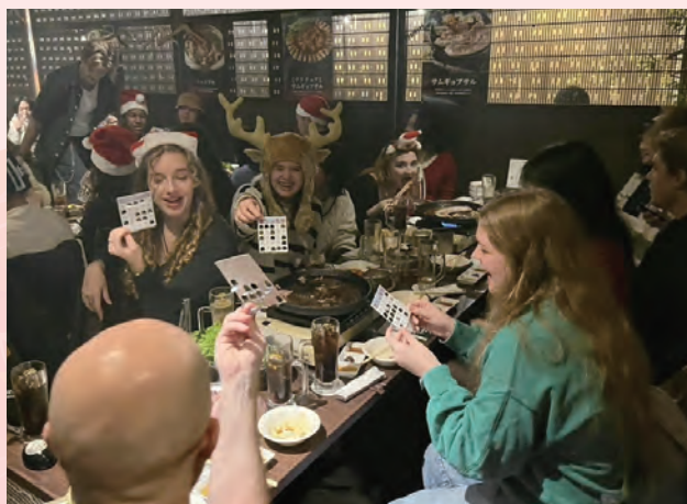
ビンゴゲームを楽しむ様子