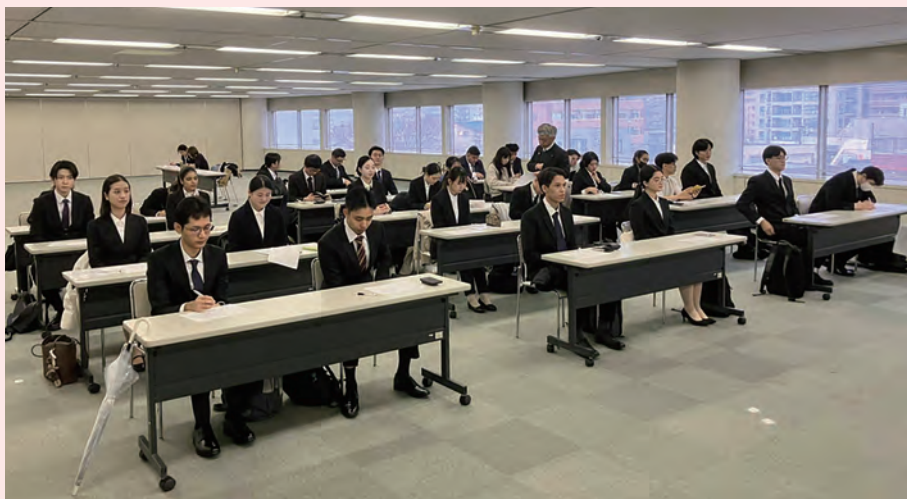
受付後に米山記念奨学金の説明を聞く学生

2025年12月20日(土)に名古屋市内の国際センタービルにて米山奨学生選考会を行いました。