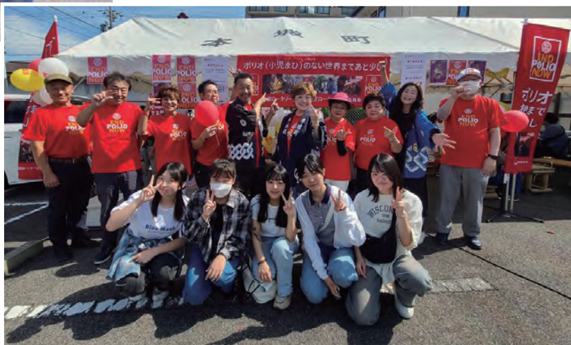
インターアクトの 皆さんとの集合写真