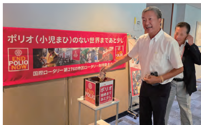
金田ガバナー補佐による ポリオ寄付の様子

当クラブは、今後もポリオ根絶運動と小児がん患者およびそのご家族の支援に取り組んでまいります。