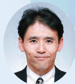
グローバル奨学生・ 平和フェロー委員長

当委員会は、「平和構築と紛争予防」に関連する平和フェローとグローバル補助金奨学生の2つの奨学金を提供するお手伝いをさせていただいております。皆様のお近くでご興味をお持ちの方がいらっしゃいましたら、ぜひお気軽に当委員会までお声がけいただきますよう、よろしくお願いいたします。