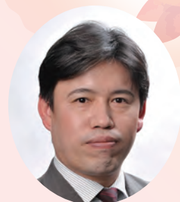
地区米山記念奨学副委員長