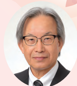
地区会員増強委員長