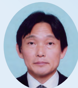
地区職業奉仕委員長

職業奉仕月間にあたり一度皆さんのお仕事を「四つのテスト」に当てはめて考えてみませんか？