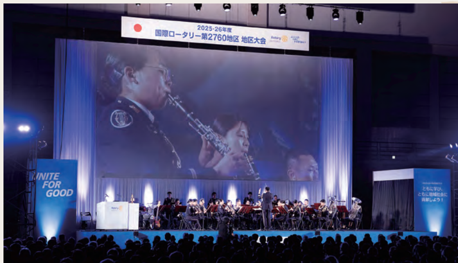
陸上自衛隊第10音楽隊による演奏