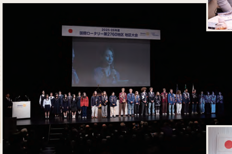
青少年・学友フォーラム