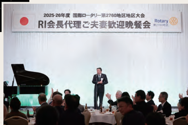
R I 会長代理歓迎晩餐会