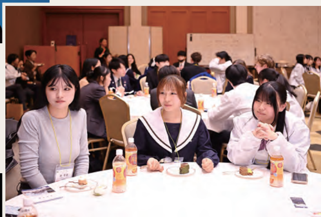
青少年クロスプロモーション交流会