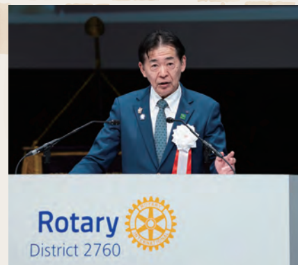
本会議 主催者挨拶