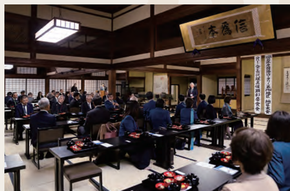
R I 会長代理顕彰昼食会