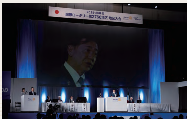
本会議 舞台上の様子