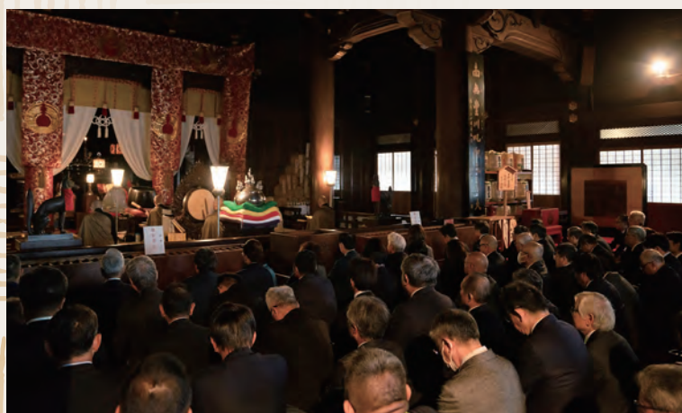
顕彰昼食会豊川稲荷参拝