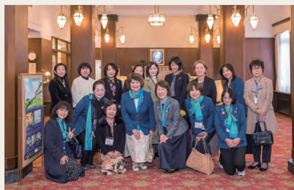
エクスカーション 蒲郡クラシックホテル