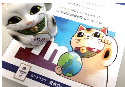
去年はお世話になりましたm(_ _)m

コロナ禍という言葉が過去のものとなりつつある今日この頃、これまで停止せざるを得なかった奉仕活動の再開を虎視眈々とうかがっている常滑RCです。常滑はアツいぜ!!