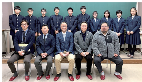
職業講話 阿久比高校インターアクトクラブ