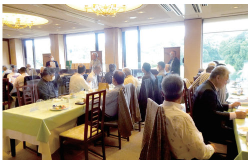
ゴルフコンペ パーティー風景