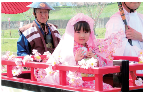
東浦町 於大まつり