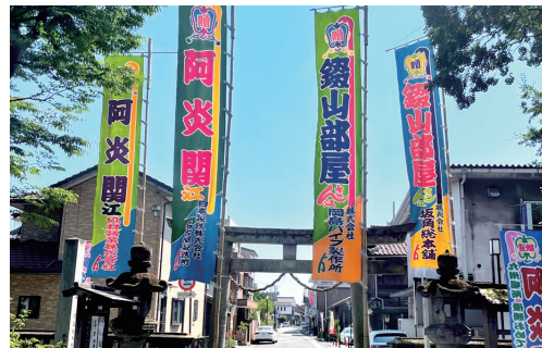
大相撲「名古屋場所」鋸山部屋 宿舎 愛宕神社