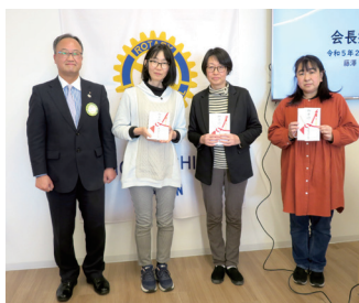
子ども食堂寄付金贈呈式

人数が少ない分、全員が全員と話すことができるクラブであり、気心が知れた仲間たちです。幅広い年齢層で、皆が知恵を出し合いながら、奉仕活動を進めていく所存です。