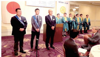
新入会員さん入会式 2023.7.5