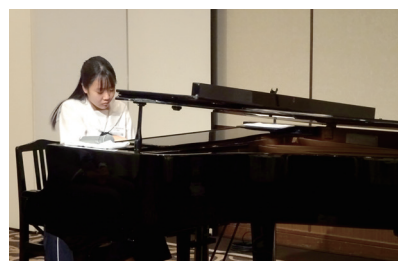
音楽奨学生招待例会