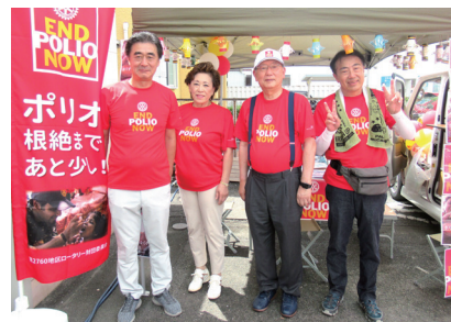
「END POLIO NOWブース」の前にて