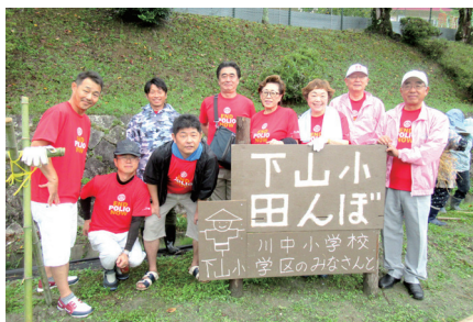
「子ども農業体験」において

当クラブでは名古屋市と岡崎市の小学校が環境・食育などをテーマに交流をする【子ども農業体験】を20年以上続けています。また、今年度は【ポリオ根絶活動】にも力を入れて取り組んでいます。クラブ会員の事業所で開催された夏祭り会場の一角に《END POLIO NOWブース》を設置し、来場者の方々にポリオ根絶の啓発と募金活動を呼びかけました。これからも未来を担う子ども達のための活動を続けていきます。