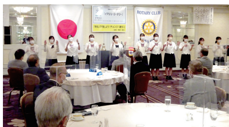
桜花学園IAC招待例会

名古屋昭和ロータリークラブは創立32年目で今年度テーマ「みんなのために、あしたのために、¡Vamos!(さあ、行こう)」のもと、会員みずから参加し周りのみんなを巻き込んで明るく豊かなあしたをつくるために活動しています。クラブの特長は古くからの住宅地、文教地区である昭和区を中心に長年の地域に密着した活動にあります。例えば昭和区役所との懇談会(トークイン昭和)が毎年開催され、地域行政機関(警察、消防)、ボランティア団体との密接なコミュニケーションと協力支援体制をもとに地域住民の「より豊かな暮らし」に貢献し活動をしています。また文教地区の特長を生かし菊里高校音楽科への奨学金事業、桜花学園インターアクト、ローターアクトクラブ支援を通じて地域の芸術、教育の振興にも注力しています。第2760地区を通じて域外の貢献活動をふくめて会員の意識の高揚をはかり、ロータリー会員としてのプライドを実感できるクラブ運営を心掛けています。