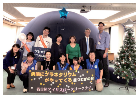
病棟内でプラネタリウム