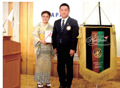
守山RCC助成金贈呈式