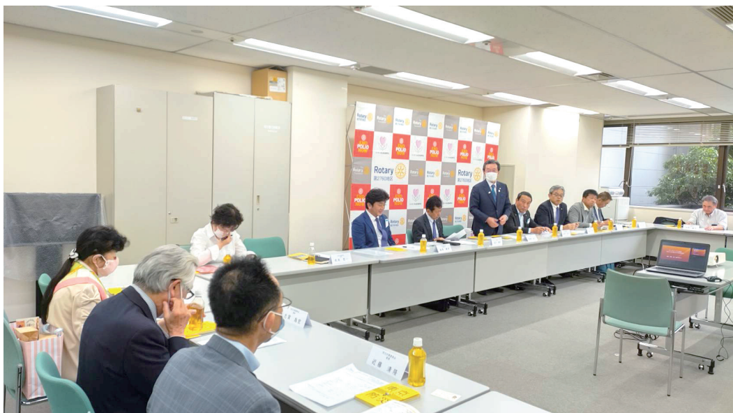
地区防災対策委員会会議風景