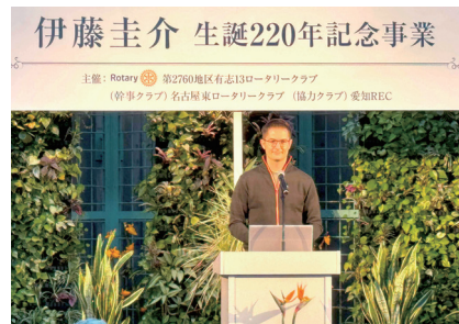
「伊藤圭介生誕220周年記念事業」協賛事業 フラリエ記念講演会