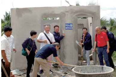
カンボジアでの国際奉仕事業 (小学校へのトイレと給水設備寄贈)

当クラブは昨年40周年記念事業を終え本年度は「人を考える、ロータリーを考える。」をテーマとし、これからの千種ロータリーの運営方針を模索する一年と位置づけています。本年も例年どおり国内外ともに積極的な奉仕活動を行っており、この秋、カンボジアTUOL KRASAING(トゥール クロサン)小学校ヘイトイレと給水設備を寄贈し、その設置作業のお手伝いに参加してまいりました。また、地元の養護施設である慈友学園の子どもたちと、ボーリング大会や小籠包づくりを一緒に楽しむことで、支援を行いました。昨年以来、新しい仲間も着実に増え、今後も一層活気あふれるロータリークラブを目指しています。