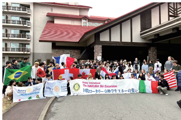
毎年3月開催の白馬研修。他地区からもインバウンド、帰国生、候補生、ROTEXが集まる事業