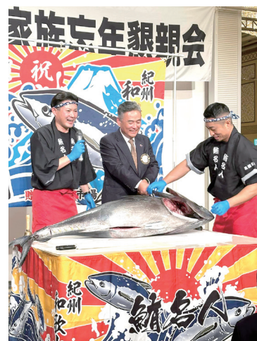
家族忘年懇親会 マグロ解体ショー