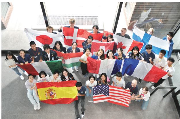
2023年に2760地区に来たインバウンドと現在の候補生と帰国生 2023.8月オリエンテーション撮影