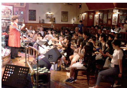
児童養護施設の子どもたちへのマジックショー & マジック教室