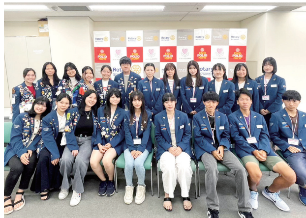
2023年春から夏に派遣された現在のアウトバウンドと、同時期に帰国した帰国生 2023.7月オリエンテーション撮影