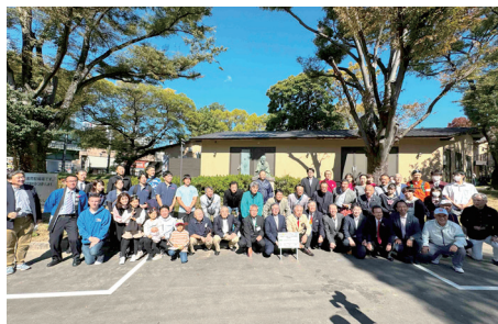
「伊藤圭介生誕220周年記念事業」協賛事業 鶴舞公園植栽事業

また、クラブ内の親睦活動もゴルフ、囲碁、麻雀、カラオケの各同好会が活発に活動しております。さらに、委員会の統廃合や女性会員の勧誘(現在女性会員2名)等、組織の活性化も積極的に行っております。