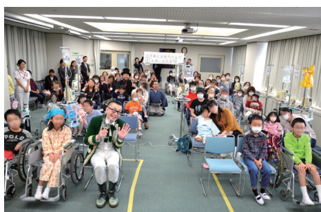
病棟内でお笑い芸人と花見会

名古屋アイリスロータリークラブは、活気と協力の輪が広がる団体です。女性会員比率が40%を超え、多様性が豊かなメンバーが交わります。特筆すべきは、柔軟性と効率性を重視し、事務局を持たないスタイルを採用しています。また、名古屋大学病院に入院する小児がん患者とそのご家族に対し持続的な支援を通じて、社会奉仕事業に真摯に取り組んでいます。未来に向けての展望として、まだまだ全国でも少ない子供ホスピスの設立支援も計画しています。名古屋アイリスロータリークラブは、温かな連帯と共に、地域社会の未来を応援して行きます。