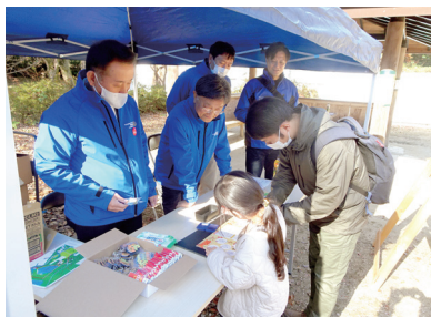
地区補助金事業「わやくちゃサミット」 スタンプラリー

下期には、グローバル補助金事業として、フィリピンに腹腔鏡手術器具の寄贈、そして60周年記念事業(守山区の子供たちを招待する御園座特別公演・守山スマートインターへの看板設置)などを行い、守山区地域密着クラブとして益々の発展を遂げて参りたいと考えております。