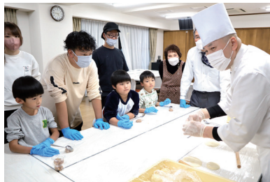
慈友学園への社会奉仕事業(スポーツイベントと肉まんづくり体験)