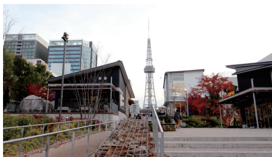
中部電力 MIRAI TOWER (旧・名古屋テレビ塔)