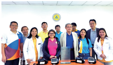
検査機器贈呈(ケソン市保健局)