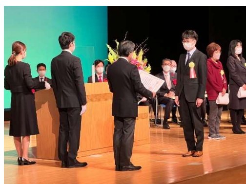
豊田市長より表彰状をいただく