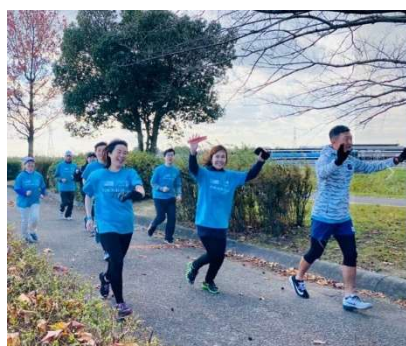
イベントのようす