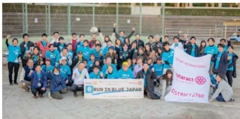
当日の参加者集合写真