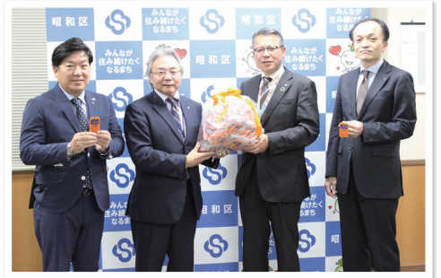
啓発キーホルダー贈呈式