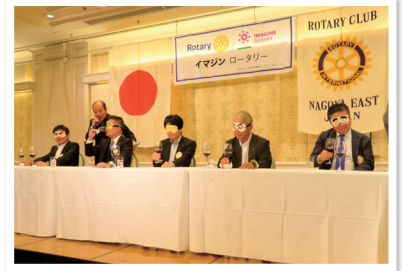
新会員歓迎会でのアトラクション（格付けチェック）

8月、9月には昨年度新たに設立提唱した名経大市邨IACと桜花学園大学・名古屋短期大学RACを例会に招待、10月にはコロナ禍で延期されていた職場例会をCBCテレビ様で開催いたしました。昨年度から新会員の入会が増えましたので、新旧の会員が親睦を図れるように例会の席を工夫したり、コロナ禍で行えなかった立食ビュッフェも復活いたしました。また次年度は東山植物園事業の支援を予定しております。