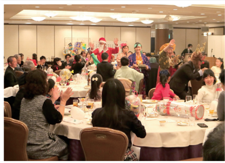
家族忘年会(クリスマス会)

名古屋名北ロータリークラブの本年度会長方針は「NO Rain NO Rainbow」で、これはハワイのことわざで、雨が降るから、虹が出る、いやな事・つらい事があった後は必ずいい事・楽しい事があります!といった意味です。コロナ禍で様々な行事が中止となり、会員間の親睦がこの2年間ほとんど出来ませんでした。3年ぶりに「家族忘年会(クリスマス会)」を名古屋東急ホテルで開催する事が出来ました。沢山の子供さんにも参加頂き、楽しいアトラクション、サンタクロース・トナカイさんからのプレゼント等、会員・家族皆で楽しい一時を過ごすことが出来ました。まだまだ厳しい状況が続きますが、会員同士の親睦と友情を深めていきたいと思っております。