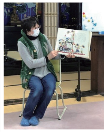
絵本の読み聞かせボランティア活動

未来のために今何ができるか、どこまでできるか、どうすればいいかを考えて活動していきます。