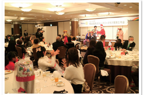
家族忘年会(クリスマス会)