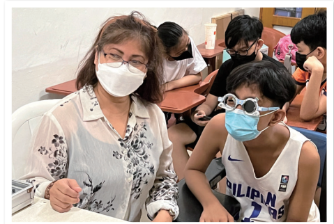
視力検査・矯正事業（フィリピン）