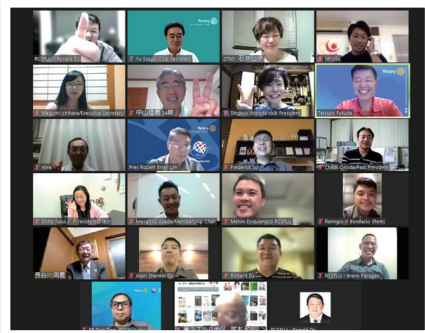
提唱クラブ サン・フェルナンドRCとのZoomミーティング

今年度のクラブ方針は【温故知新】。チャーターメンバーの想いと功績を大切にしながら、新しく若い力も戦力にクラブ活動を盛り上げていきたいと願っています。