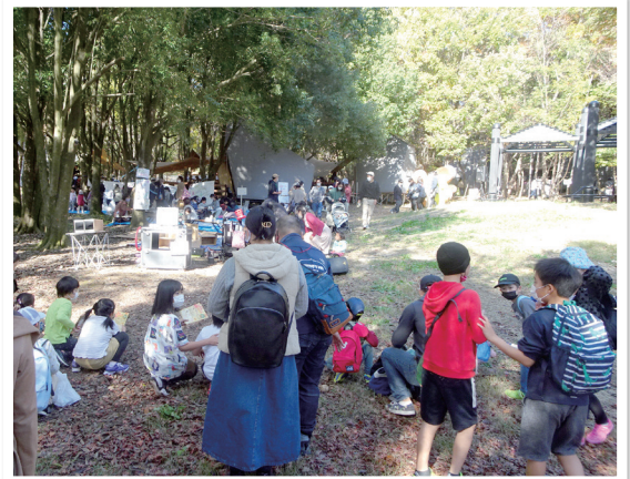
イベントを楽しむ人々