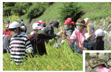
子供農業体験 稲刈りの様子

また新しくフィリピンにある17か所の小学校に給水所を設置する計画も始まりました。長期にわたる国際奉仕ではありますが継続をしていきたいです。