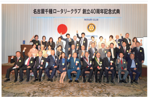
創立40周年記念式典

また、クラブの親睦も充実しており、家族懇親会や新年会、節分例会などを実施しております。特に12月のクリスマス例会には、家族のちびっこ達も毎年のサンタの贈り物を楽しみにして、大勢あつまり、大喜びしました。本当にあつたかい、ぬくもりのあるひとときでした。