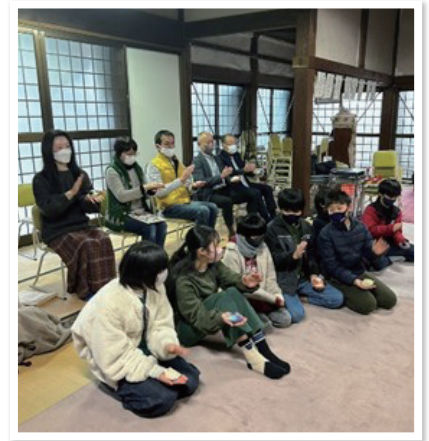
絵本の読み聞かせボランティア活動