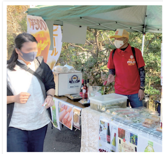
キッチンカーの手伝い