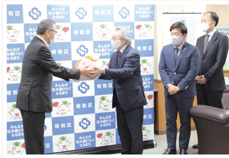
啓発キーホルダー贈呈式