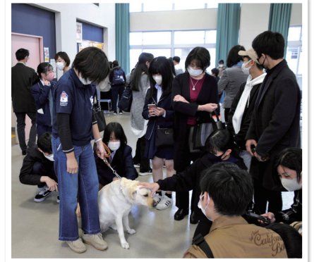
中部盲導犬総合訓練センターの見学会