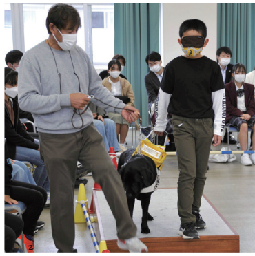
中部盲導犬総合訓練センターの見学会

今年度は、地区補助金を活用して、『視聴覚障害者を支える盲導犬を学ぶ』をテーマに中部盲導犬総合訓練センターの見学会を行いました。これまでに多くの盲導犬を育てた現場を訪ねて盲導犬についてより理解を深め、障害者へのボランティア活動の推進に繋げることができました。参加者は青少年奉仕に関連する、インターアクト、ローターアクト、米山奨学生、米山学友などのロータリーファミリーと会長、幹事をはじめ名東RCとの交流を深めた有意義な一日でした。また今年度は初めてのハイブリッド例会を開催することができました。ウイズコロナの中で、会員の叡智を出し合いながら、青少年育成や地域社会との連携を更に強化し未来に続く活動に取り組んでいきたいと考えています。