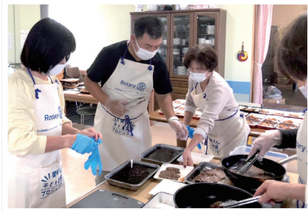
11月19日 子ども食堂の支援

次に当クラブの親睦の根底には家族主義もあり、家族参加の例会も毎年複数回実施しております。そのほか珍しいところでは、永平寺名古屋別院での早朝例会も恒例として実施しております。写真は、8月に実施された早朝例会での会員の座禅の様子を撮影したものととなります。