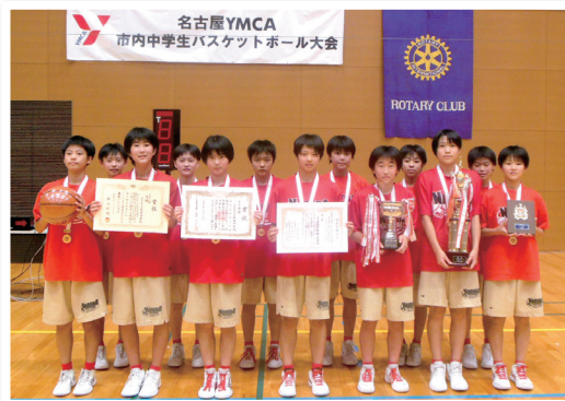
名古屋市内中学校バスケットボール大会

コロナ禍の下、多くの活動に制約を余儀なくされていますが、諸先輩方々の活動を踏襲しつつ、近年では、名古屋市内中学校バスケットボール大会、YMCA主催の障がい児支援「名古屋チャリティーラン」への支援等、青少年奉仕活動に注力しています。