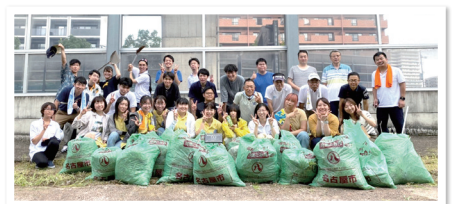
8月第1例会集合写真

職業奉仕活動として、例会を通して、メンバー同士が事業面においても信頼関係をより強く築ける様、メンバーの為のメンバーによる卓話の時間を充実させました。社会奉仕活動として、名古屋養護学校への支援活動、音楽会等の継続開催。歳末助け合い募金への寄付。青少年奉仕活動として、名古屋中央ロータリークラブと協力して「献血活動」及び「緑の散歩道」への支援。そして本年度より、国際奉仕活動として、知立団地の日本在住の外国人小学生(1年生)へのランドセル寄贈を地元NPO法人と共に行う事といたしました。又、会員増強に関して、量より質に重点を置き、入会希望者への研修の充実を計りました。幸いなことに、11月の時点で5名の新入会員に入って頂く事が出来ました。当クラブは60・80運動を5年計画で進めており、60周年までに会員を80名に戻すという目標を立てております。