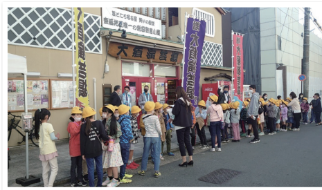
2022年10月26日(水) 地区補助金事業『笑って学ぼう 私たちのまち』開催 子ども達がこれから大須演芸場に入ります