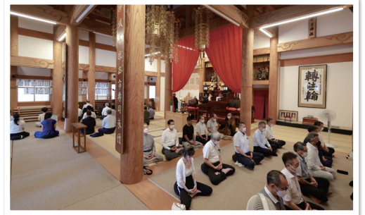
永平寺名古屋別院での早朝例会