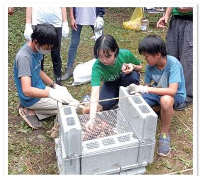
8月キャンプトレーニング(野営訓練)