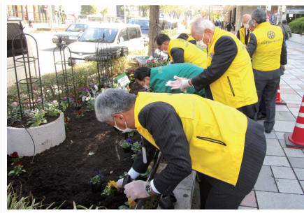
「おもてなし花だん」活動

名古屋西ロータリークラブは、次年度(2023-24年度)に70周年を迎えます。例会日は毎週木曜日。例会場は名古屋マリオットアソシアホテルです。会員数は92名を数え、地元企業の経営者、名古屋に転勤なされた企業の責任者、会社をリタイアされたあとも個人会員としてメンバーになられている方など色とりどりで、「自由闊達さ」をクラブの気風とし、本年度のクラブテーマは「未来を語り合おう」です。社会奉仕活動は2011年から10年に涉り、東日本大震災に罹災され、福島から名古屋に移住されたご家族への支援活動を行ない、現在は緑の少ない名古屋駅近辺に花を植える「おもてなし花だん」活動を行なっています。