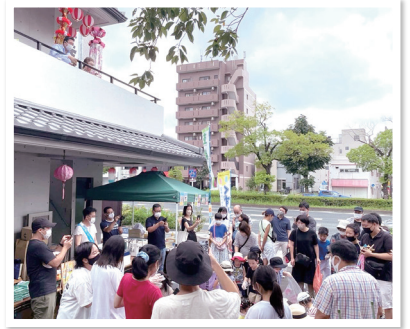
地区補助金事業 「未来の扉 子どもたちの笑顔を守ろう!」

地区補助金事業としては「未来の扉 子どもたちの笑顔を守ろう!」と題し、8月21日に子ども食堂を開催し、食事の提供だけでなく交流の場となるよう、地域で活躍するパフォーマーによるダンスや剣舞披露などで、約100名の児童に楽しんでもらいました。12月18日開催予定の第二回ではVtuber を交えたオンライン座談会も計画しています。