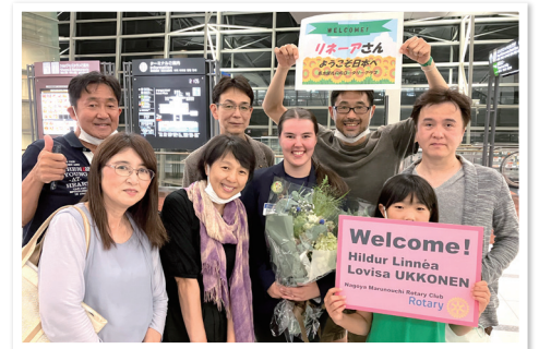
フィンランドからの留学生来日

コロナウイルス流行前のロータリークラブが本来あるべき姿を取り戻すために、これからも奮闘してまいりたいと考えております。今後も名古屋丸の内ロータリークラブを何卒よろしくお願い致します。