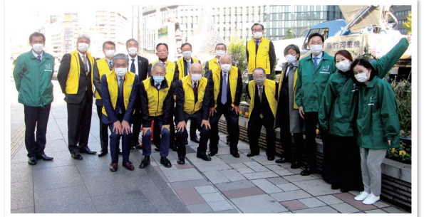
「おもてなし花だん」活動