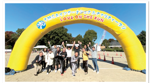
第29回名古屋YMCAインターナショナルチャリティーラン2022 2022年11月5日(土)名城公園にて開催 名古屋中RCチームで参加