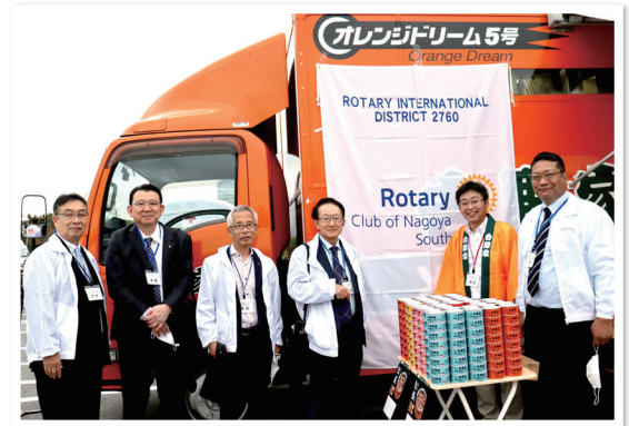
防災キッチンカーによる備蓄食料提供(あいち防災フェスタ)