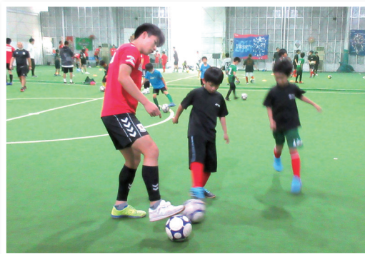
名古屋オーシャンズによるフットサル教室