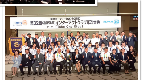
2022年次大会 集合写真