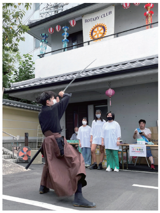
熱田区・想念寺にて

今年度の会長方針は「ロータリーライフを楽しみ、クラブの持続的成長を図ろう」です。地域社会との共生を軸にした積極的な奉仕活動など、良き伝統をしっかりと継承する一方で、会員一人一人が参加したいと思える例会や委員会活動ができているか、また時代に即した内容かを改めて見直し、変えるべきところは柔軟に変え、活力あるクラブを目指しています。