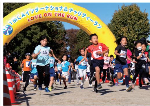
YMCA主催の障がい児支援「名古屋チャリティーラン」