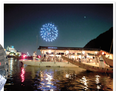
秋の家族会「長良川鵜飼」