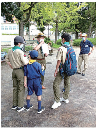
ボーイスカウトと一緒にゴミ拾い活動

中部名古屋みらいRCは音楽・教職・医療関係の専門職、外国籍会員が多いのがクラブの特長です。そして、活動の一つに青少年育成支援があります。