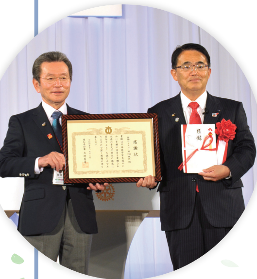
寄附目録贈呈（愛知県）