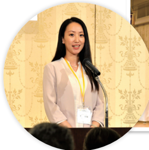
米山記念奨学委員会活動報告