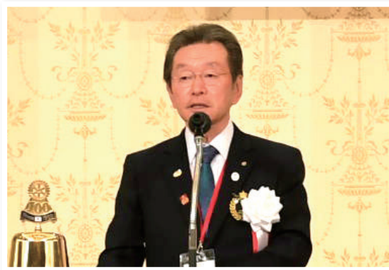
地区大会1日目主催者挨拶

これまで、聞いたことがあっても実際にはどんな活動をしているのかまではわからなかった青少年関連の事業について、当事者であるファミリーたちの、わかりやすく、また、大変熱のこもった発表のおかげで、この先様々なクラブがこれらの事業に前向きに取り組んでもらえるきっかけになったのではないかと考えております。