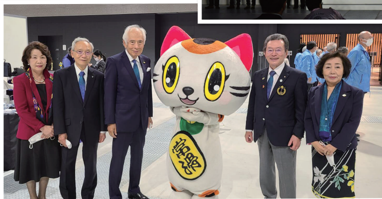
トコタンとRI会長代理 ガバナーご夫妻、エイドご夫妻と