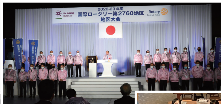
次年度 ホストクラブ紹介