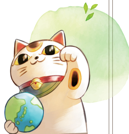
表紙／2760地区閑話小題

いつからか忘れましたが、常滑市のいたるところに猫のデザインが溢れるようになりました。常滑のシンボルとなった招き猫が手にするのは緑の地球です。いつまでも美しく碧く光る地球でありつづけることを、優しく後押しするロータリーでありたいとの願いを込めました。