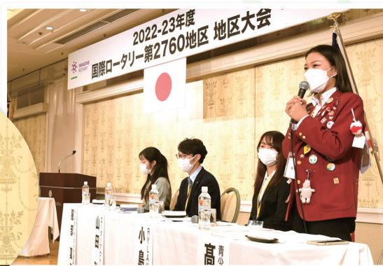
青少年フォーラムパネルディスカッション