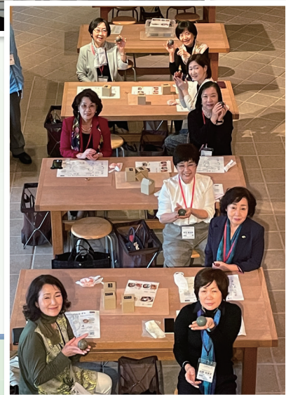
ファミリー プログラム