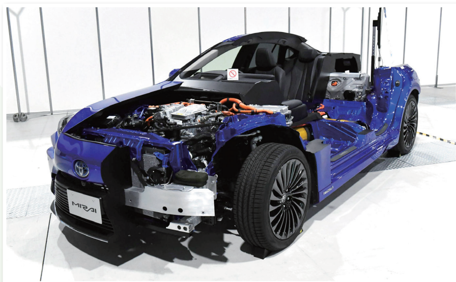
カーボンニュートラル展示(トヨタ自動車)

動画を交えながら、わかりやすくまた、興味深くお話を聞くことができたのですが、特筆すべきは、うかがったお話を実現したトヨタのFCV3台を同会場内に展示できたことです。地区大会というイベントの趣旨をご理解いただき、大変前向きに協力してくれたトヨタ自動車に感謝です。