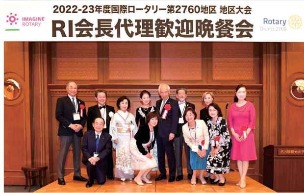
RI会長代理歓迎晩餐会(地区外出席者)