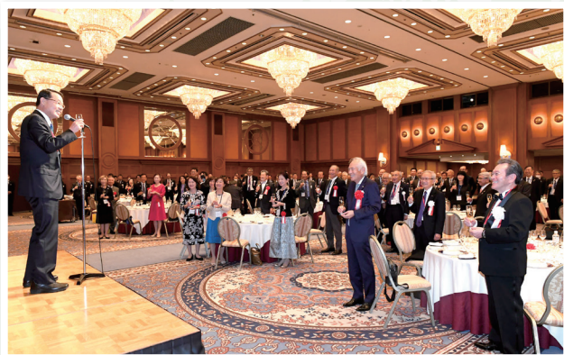
RI会長代理歓迎晩餐会(乾杯)