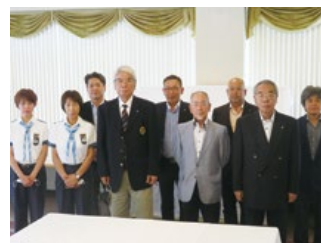
青少年育成資金贈呈事業

この先、この環境がどう変化していても我々は状況に応じてやるべきこと、できる事をコツコツと積み上げてこの仲間たちと事業を行って参りたいと思います。