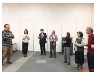
元世界チャンピオンのヨーヨー講座