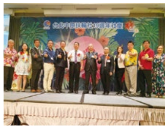
台北中原 RC 周年