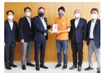
要介護者支援事業(犬山市)