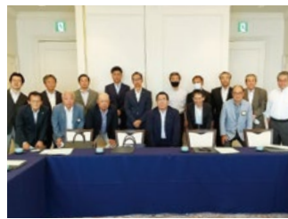
第1回理事役員会にて