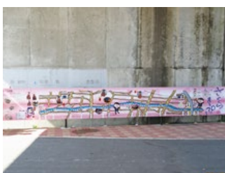
「岩倉桜まつり」案内板設置

岩倉RCは、ご存知のとおり極少人数のクラブですが、それを利点として生かすことにより、ロータリーの目的と理想を体現しているのではないかと考えています。まずは、少人数であるが故に、会員相互の人となりがみえることで、互いに敬意を払い互いの立場を尊重することができます。これは真の親睦と言えるのではないのでしょうか。また、奉仕の面では、活動の主拠点となる岩倉市自体が人口約4万8000人という小さな街ということもあり、各会員が持つ人脈も生かしながら、役所を始め学校や各種団体等と密接に連携した活動が可能となっています。この中には、岩倉市が誇る約1400本の桜並木が続く五条川の環境保全に関連する各種事業や、元世界チャンピオン3名を輩出した岩倉市が目指す「ヨーヨーのまちいわくら」への側面からの支援もあります。今後も、小規模故の利点を生かしながら、基本に立ち戻った活動を継続していきます。