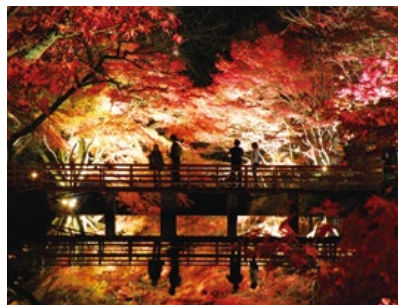
岩屋堂紅葉ライトアップ