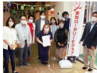
共和西児童館への奉仕活動

愛知ロータリーEクラブの今年度のクラブテーマは『奉仕で広げよう 友愛の輪』と致しました。奉仕活動を会員の皆さんで力を入れ共に行う事で、会員同士の友愛の輪を広げていこうとするものです。「コロナゼロへの取り組み」として、例会の際の感染防止のため、ウイルスカバーをクラブ備品として購入し、会員席間に設置いたしました。また奉仕活動として共和西児童老人福祉センターへ消毒液やタオルの寄贈を行いました。更に久屋大通庭園(フラリエ)へ足踏み式消毒液スタンド(愛知ロータリーEクラブ寄贈と名入れ)と消毒液を寄贈し、感染防止にご協力いたしました。「カーボンゼロへの取り組み」は鉢植え植物を会員が購入し自宅でカーボンゼロを実施するとともに、鉢植え代金の2/3をポリオゼロ基金へ寄贈致しました。愛知ロータリーEクラブは、WEB例会に加え月に1度は実例会や奉仕活動で会員が顔を合わせてロータリー活動を続けております。