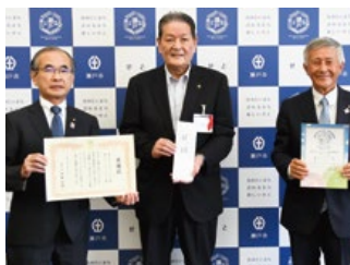
瀬戸市子どもの今・未来応援基金贈呈式

今年度になり、まん延防止等重点措置や緊急事態宣言発令で食事なし例会や例会取消をした事で例会活動費に余剰ができました。コロナ禍で何か役立てる事はないか模索していたところ、瀬戸市で「瀬戸市子どもの今・未来応援基金」が創設された事を知りこの基金の先駆けになればとの考えで寄付を決定しました。はじめは当クラブだけで考えておりましたが、瀬戸北RCも同様に考えておられる事を知り、同じ瀬戸市を所在地とする2つのクラブが「ロータリー奉仕デー」として寄付する方がより大きく地域社会に貢献できる事から、2クラブで贈呈を致しました。我々の寄付はコロナ禍で収入が減少し経済的に困窮する家庭や子ども食堂への食糧や衣類などの生活必需品の支援に利用されるそうです。今回の寄付支援が困難に直面する子供たちの現状理解のきっかけとなり、次年度からは個人・企業の立場からの寄付につながっていかれると思っております。