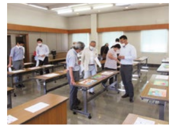
猫の絵選考会風景