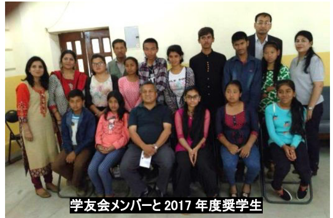
学友会メンバーと2017年度奨学生

支援することが可能です。今年度は引き続き23人を奨学生として支援するほか、この7月から被災地の村での新たな支援活動を計画しています。義援金の使途については、今後も続報が入り次第、随時報告してまいります。