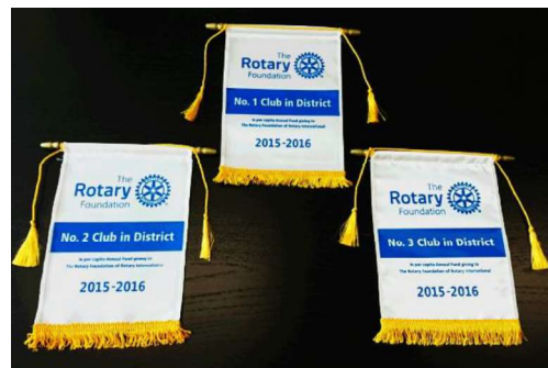
年次基金への一人当たりの寄付額上位3クラブ

各地区内で、一人当たりの年次基金への平均寄付額*が上位3位に入ったクラブに贈られます。資格を得るためには、クラブは一人当たりの年次基金への平均寄付額*が最低50ドルに達していなければなりません。