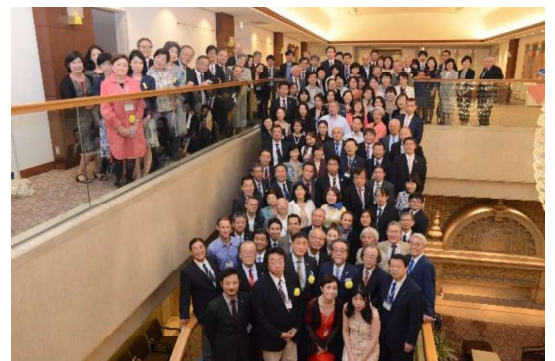
会場 如水会館にて(都内)