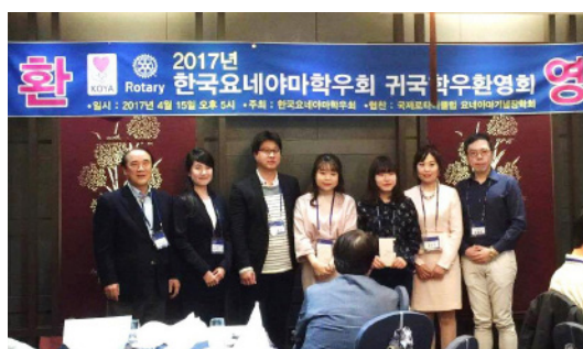
日本人奨学生とそのメンターとなる学友を囲んで

って留学生生活を支援するもので、昨年からスタート。親交の深い台湾米山学友会が 2009 年から実施する「日本人若手研究者対象奨学金」がモデルとなっています。奨学金の原資は、韓国学友からの寄付が主ですが、今年は、韓国ロータリーの関係団体など新たな賛同者からの寄付も増え、昨年