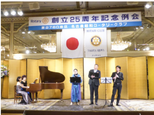
祝宴:ロータリー財団学友の名古屋音楽大学学長はじめ教授、講師の方々