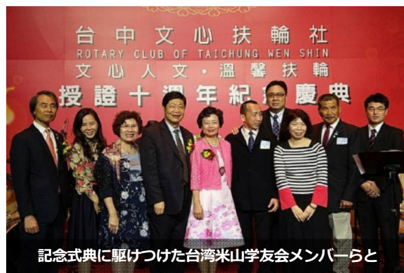
記念式典に駆けつけた台湾米山学友会メンバーらと

何さんによると、創立時 32 人だった会員は、この 10 年で 61 人と倍増。米山学友の創立会員 8 人のうち、結婚、出産や海外転勤などで 4 人が退会する