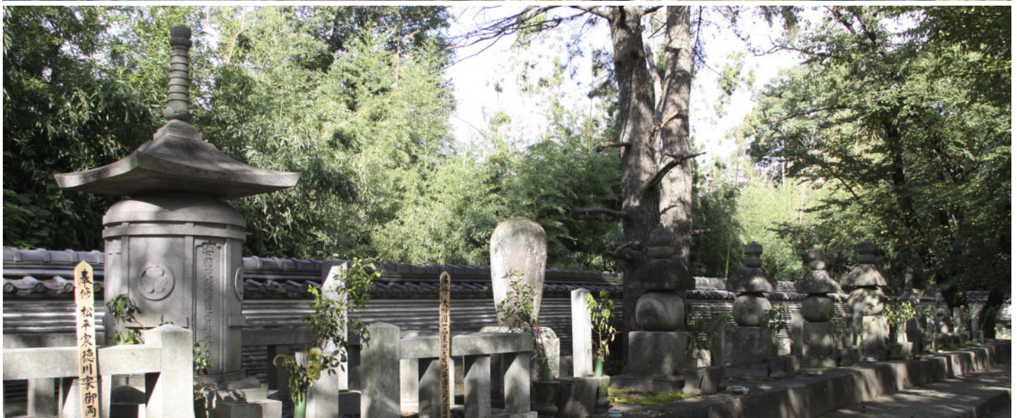
表紙の写真： 左上：日光東照宮の宝塔 右上：久能山東照宮の宝塔 下：大樹寺の松平八代・家康公墓地