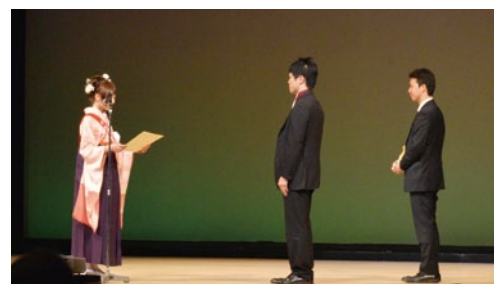
会員増強賞の表彰