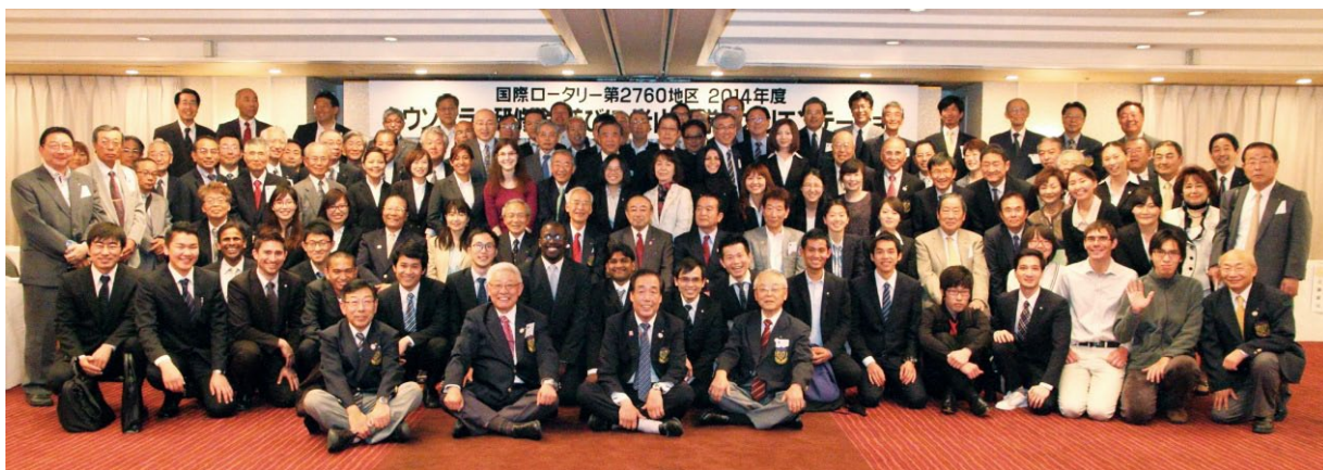
奨学生36名を含め総勢147名