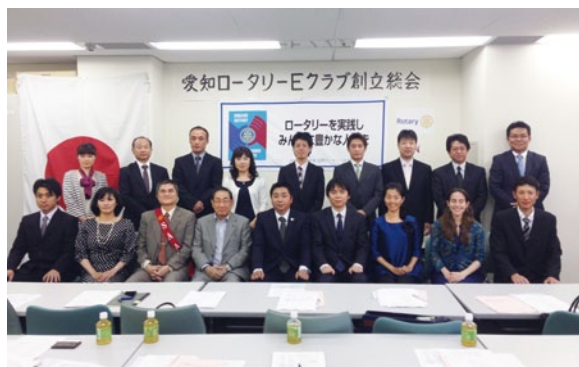
愛知ロータリーEクラブ創立会員の皆様

これから日本のロータリアンが爆発的に増えることは困難と思いますが、退会を減らすことはできると思います。ロータリーの原点、本質に目を向け、自らが学び、実践し、磨き上げ、真のロータリアンとして輝くことで友人と繋がるのが第一歩だと思います。それには親睦が大きな力となるでしょう。ロータリーは個人、クラブが中心であります。