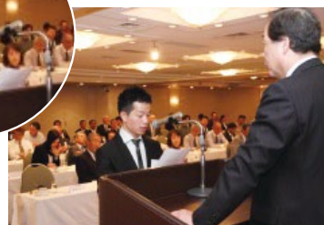
誓約書宣誓代表奨学生