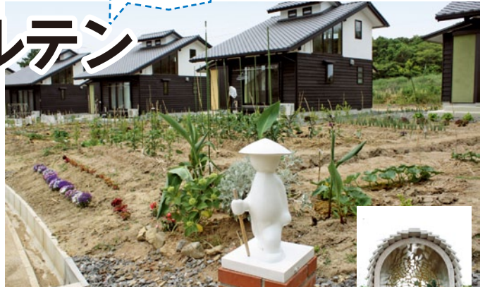
10棟のラウベが並ぶクラインガルテン。野菜や花も息づいて。近くには弘法道もある。

樹木のすき間から聞こえる鶯の鳴き声が心地いい。緑の風がほほをなぞ、青い海と空が広がる。菜園にはトマト、ナス、カボチャなどの野菜が息づいている。ここは佐久島クラインガルテン。離島では全国初という宿泊滞在型農業体験施設、スローライフ提供の施設でもある。