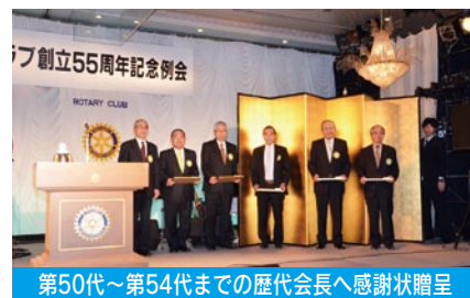
第50代～第54代までの歴代会長へ感謝状贈呈

ロータリーファミリーで祝いたい！工夫して欲しいとの要望で、担当委員会のメンバーで知恵をだし合って、アトラクション以外は全て手作りの周年記念例会でした。