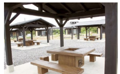
一般の人でも利用できるバーベキュー広場。