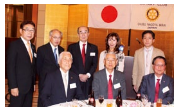
来訪されたパストガバナーの皆さんと