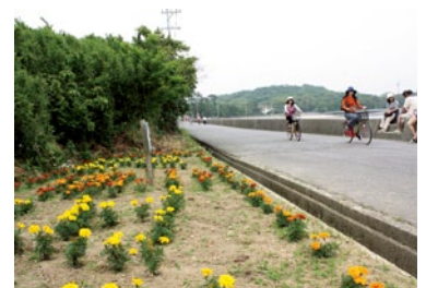
海岸道に沿ってフラワーロードがある。