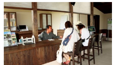
管理棟。棟内も広く、くつろげる。管理人が常駐し、お世話をしてくれる。