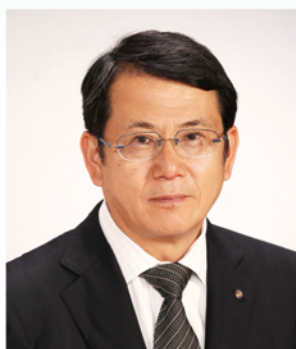
国際ロータリー第2760地区 2013-14年度ガバナー