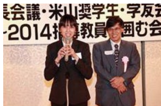
奨学生と指導教員