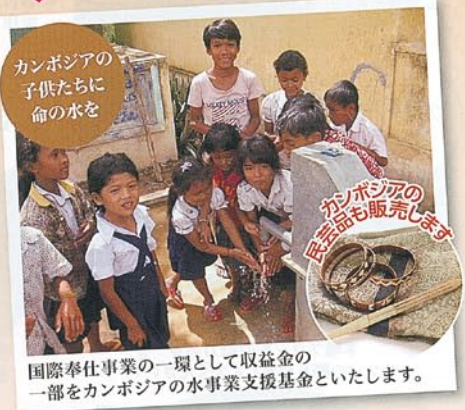
国際奉仕事業の一環として収益金の一部をカンボジアの水事業支援基金といたします。