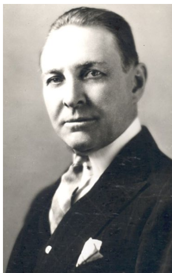
ロータリー財団の父 アーチ・C・クランプ

2013-2014 Rotary International District 2760