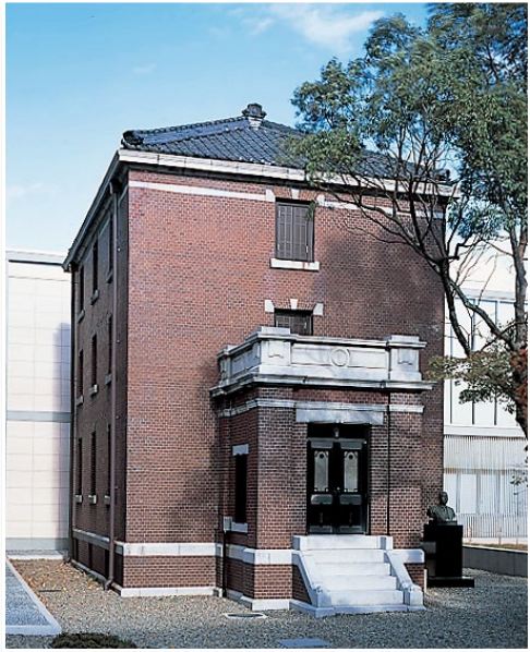
▲煉瓦造り地上3階、地下1階の書庫