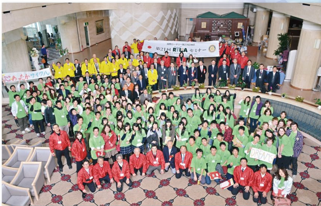
※写真は第21回RYLAセミナーを使用しています。