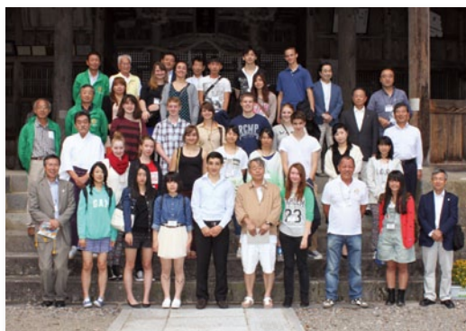
▲長滝白山神社・若宮宮司とともに