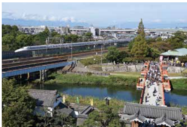
清洲城から見た五条川と新幹線と名二環