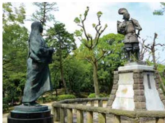
織田信長と濃姫の像