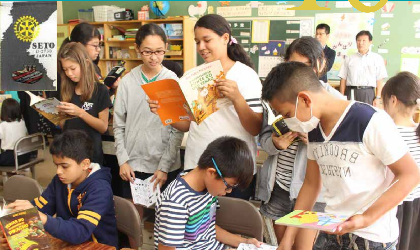
瀬戸市立原山小学校の外国籍の子供たち