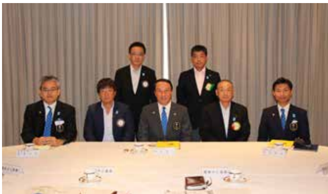
会長幹事懇談会記念撮影

定刻の12時30分より始まった合同例会の卓話ではR I 会長テーマ「ロータリー：変化をもたらす」について、ロータリーは自らの職業の倫理性を高め、それを通して「世界でよいことをしよう」という理念を変えることなく、私共の志、自分たちの奉仕活動を周りの方にもっと伝播していくことが求められているのではないかと。奉仕という行動を通じて自分自身を含め人々の人生に変化をもたらすこととメッセージ説明をされ、続いて地区方針「今日からのロータリーを楽しもう！」地区ビジョン「10年後、20年後も地区の輝きが持続可能である」と致し5つの行動指針、クラブ中期計画策定のためのクラブ戦略委員会の設置、クラブと地区の行事への参加、周りへの積極的働きかけ、ロータリーファミリーとの連携強化、会員増強を力強くお話ししていただき結びにWFFの参加、My Rotaryへの登録50%のお願いで閉会となりました。両クラブロータリアンにとって素晴らしいガバナー公式訪問でした。