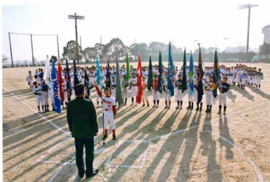
第17回 東知多・大府ロータリー旗争奪少年軟式野球 21世紀大会 2016年11月20日より