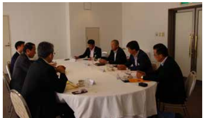
会長幹事懇談会の様子