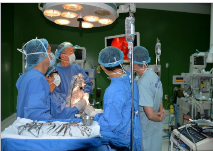
ベトナムのダナンの市民病院へ派遣しているVTT医療チーム派遣プロジェクトです。