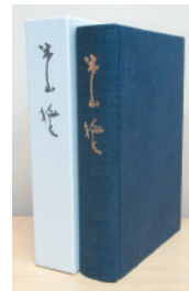
A5判 上製本ケース付 本文590ページ/4,000円