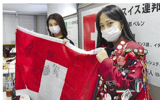
カルチャーフェアの様子（2022年5月）

タイムスケジュールは予告なく変更となる場合がございますので、予めご了承をお願い致します。