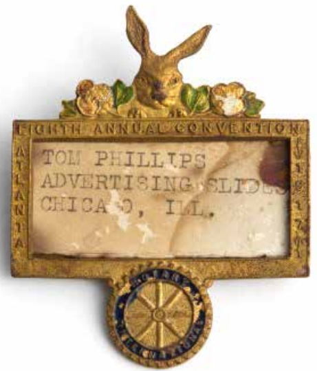
1917年アトランタ大会 で使われたネームバッジ