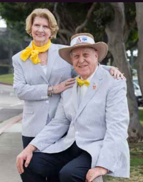
2016-17年度国際ロータリー会長 ジョン F. ジャーム

学び、感動し、新しい友人と出会い、旧友との再会を楽しむために、アトランタにお越しいただけることを願っております。年に1度のロータリーの祭典、そしてロータリー財団100周年という節目を祝うこの機会に、妻ジュディーとともに皆さまをお待ちしております。