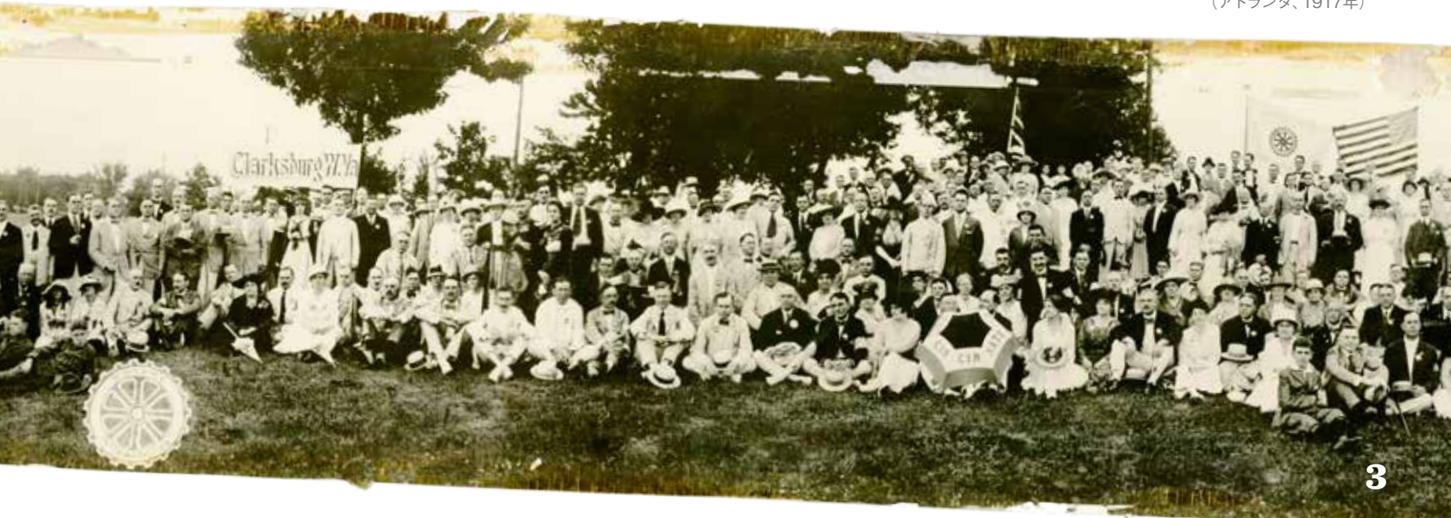
ロータリー年次大会の様子 (アトランタ、1917年)