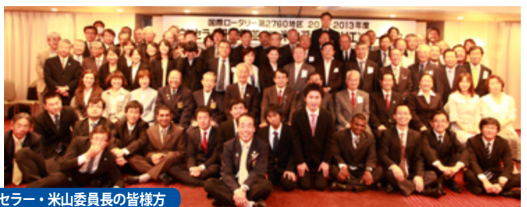
奨学生・世話クラブ・カウンセラー・米山委員長の皆様方