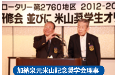
加納泉元米山記念奨学会理事