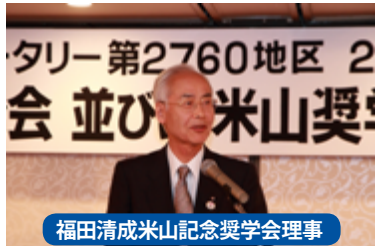
福田清成米山記念奨学会理事