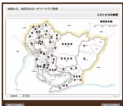
図1: 地区内各クラブの地図からの検索画面 (愛知県版)

前回の「広報委員会よもやま話-4」でもお願いしましたように、地区内各クラブに、対外的なクラブ活動の事前告知、事後の報告、例会卓話の事前案内等の情報提供を順次お願いして参りたいと思います。各クラブの会長、幹事、広報委員の皆さまには、是非、定期的で継続的な情報提供のご協力をお願いいたします。