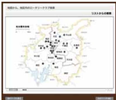
図2: 地区内各クラブの地図からの検索画面 (名古屋近郊版)