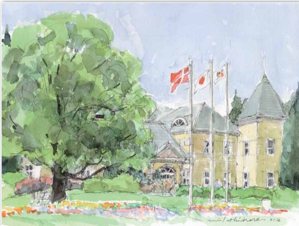
お花畑（安城市産業文化公園・デンパーク） 画 石原ミチオ