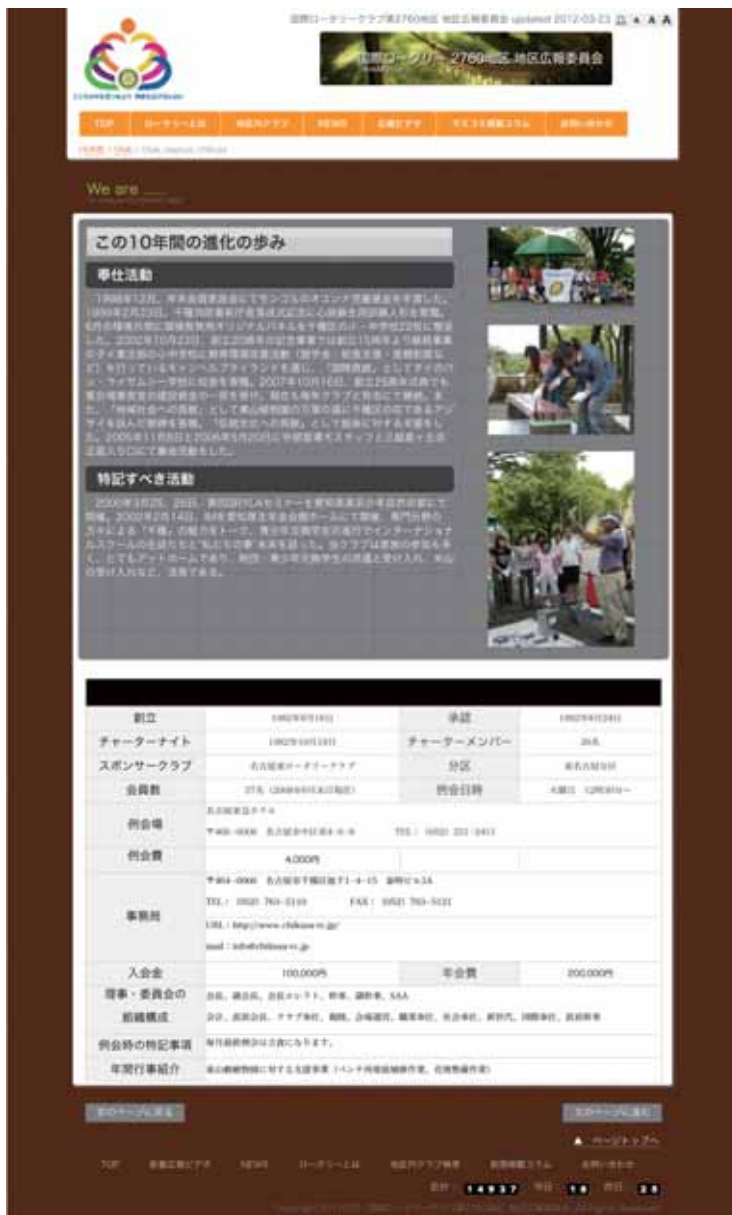
図4: 地区内クラブの自己紹介および基本情報掲載画面