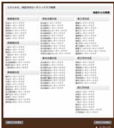
図3: 地区内各クラブの一覧表からの検索画面