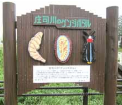
庄司川にある田原市の案内板

自然のありがたさを知り、そして交流によって他のクラブとの友情をより一層深めるためにも、この蛍例会が何年もつづく事を祈っております。