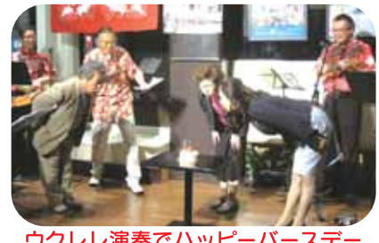
ウクレレ演奏でハッピーバスター