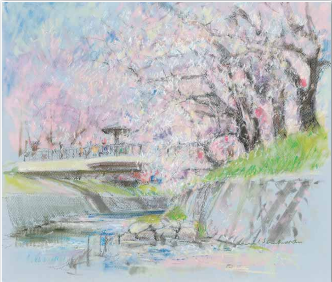
春爛漫(岩倉市五条川) 画 石原ミチオ